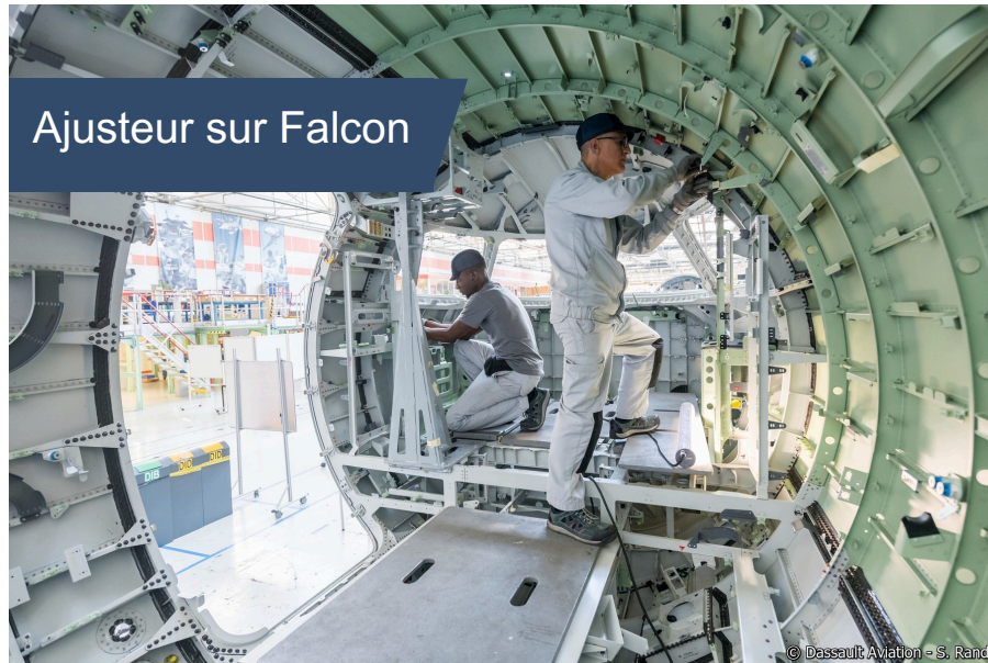
Ajusteur sur Falcon