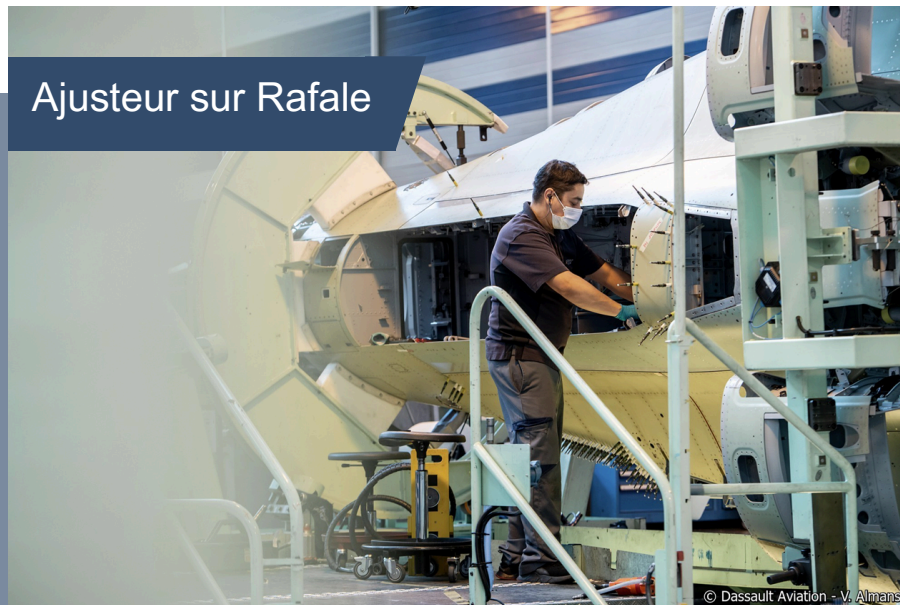
Ajusteur sur Rafale